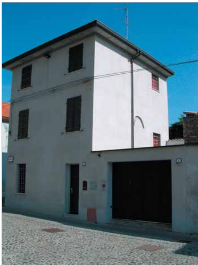
Piazza Carducci 4; 5 Fronte Principale